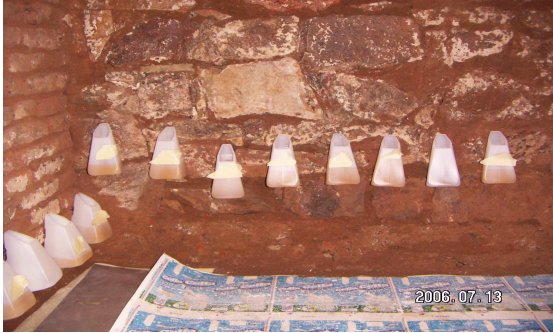
Bild zeigt die Trichtertränkung einer befallenen Wand

a.: Eine Tränkung, z.B. mittels Trichter mit STONE-BLISS Konzentrat sollte zur Pilzbekämpfung im tieferen Mauerwerk vorgenommen werden. Bohrungen im Abstand von ca. 20 cm vornehmen, wobei die Bohrlöcher in einer Schräge von ca. 45° angesetzt werden, wenn eine Trichtertränkung mit haushaltsüblichen Trichtern durchgeführt werden soll. Wenn die immer wieder gefüllten Trichter sich nicht mehr von selbst entleeren, ist der Sättigungsgrad erreicht.