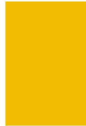
C-661 IV Maisgelb